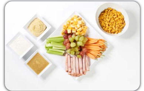
plateau-collation pour enfants