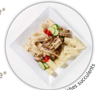
les sandwiches succulents