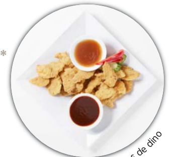
les pattes de dino