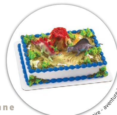
gâteau d'anniversaire - aventure Dino

Toute commande devra être passée le mardi de la semaine précédente.