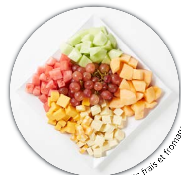
assiette de fruits frais et fromages