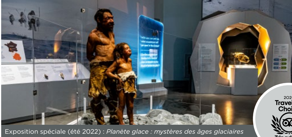
Exposition spéciale (été 2022) : Planète glace : mystères des âges glaciaires